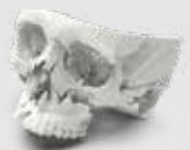
手術計画のための 医療用頭蓋骨