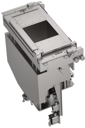
350 x 350 x 350 mm RPM

コンパクトなフレームに大型造形容量とトリプルレーザ構成を搭載しています。DMP Flex 350 Triple は、金属部品生産向けの効率的で適応性のあるソリューションを提供します。このプリンタは、3D Systems のクラス最高の真空チャンバ設計を採用し、シームレスなステッチング機能を備え、さまざまな造形サイズを持つ 2 つのリムーバブルプリントモジュール (RPM) をサポートすることにより、特徴的な RPM コンセプトを拡張します。