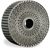
LaserForm AlSi10Mg (A) の冷却チャンネルの熱交換機

3D Systems が提供する広範囲で、すぐに使用可能な LaserForm 材料は、3D Systems の DMP プリンタ専用で調整されており、高品質で一貫した部品特性を実現します。3D Systems では、当社の複数の部品生産施設でさまざまな材料を使って広範囲に開発、テスト、最適化したプリントパラメータデータベースを提供しています。これらの部品生産施設では、長年にわたり、難易度の高い 100 万種類以上の金属量産部品をさまざまな材料でプリントしてきたため、比類のないノウハウを持っています。