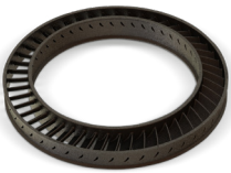
認定 HX (A) を使用した高温での腐食耐性を備えたタービン翼