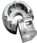
LaserForm Maraging Steel (B) を使用した等角穴のプロモールド