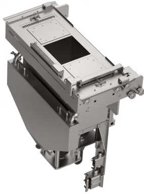
275 x 275 x 420 mm RPM