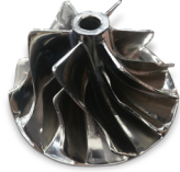
LaserForm 17-4 ph (A) で造形されたスケールテストのためのミニアクター