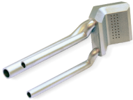
LaserForm Ni718 (A) を使用した冷却チャンネル内蔵ガスバーナー