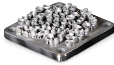
LaserForm CoCr (C) を使用した歯科用パーシャル、コーピング、ブリッジ