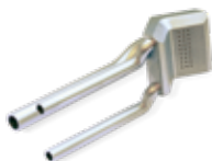
LaserForm Ni718 (A) を使用した冷却チャンネル内蔵ガスバーナー