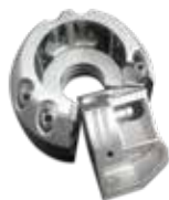
LaserForm Maraging Steel (B) を使用した等角穴のブローモールド