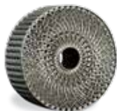
LaserForm AlSi10Mg (A) の冷却チャンネルの熱交換機

3D Systems が提供する広範囲で、すぐに使用可能な LaserForm 材料は、3D Systems の DMP プリンタ専用で調合、微調整されており、高品質で一貫した部品特性を実現します。3D Systems では、当社の複数の部品生産施設でさまざまな材料を使って広範囲に開発、テスト、最適化したプリントパラメータデータベースを提供しています。これらの部品生産施設では、長年にわたり、難易度の高い 100 万種類以上の金属量産部品をさまざまな材料でプリントしてきたため、比類のないノウハウを持っています。