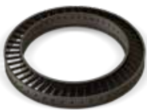
認定 HX (A) を使用した高温での腐食耐性を備えたタービン翼