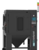
POSTPRO DP PRO