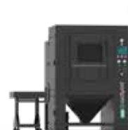
POSTPRO DP MAX

タンブルベルトテクノロジーを活用した 2-in-1 脱粉およびショットブラスティングシステム