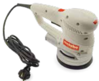
Gabinete de lixadeira impresso em material DuraForm PA

Os sistemas sPro SLS da 3D Systems compartilham uma arquitetura em comum para produzir peças termoplásticas de alta resolução e duráveis disponíveis em volumes de construção médio a grande.