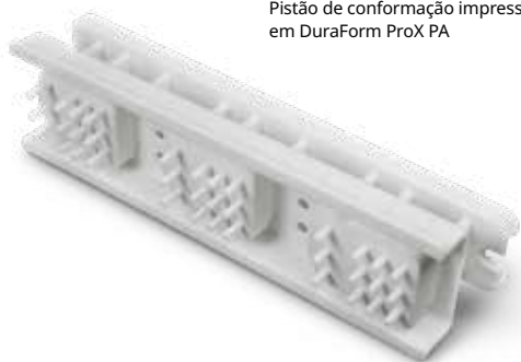
Pistão de conformação impresso em DuraForm ProX PA

Garantia/Isenção de responsabilidade: as características de desempenho destes produtos podem variar de acordo com as aplicações do produto, as condições de operação, a combinação de materiais ou com a finalidade. A 3D Systems não oferece nenhuma garantia, expressa ou implícita, incluindo, entre outras, garantias de comerciabilidade ou adequação a uma finalidade específica.