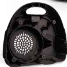
Tampa traseira de aspirador de pó impressa em DuraForm EX Black