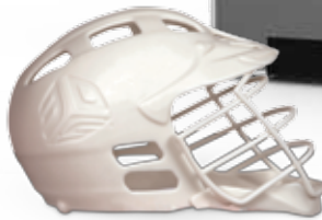
Helmodell, gedruckt in Accura Xtreme White 200