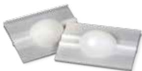
Mikrofluid-Mixer , gedruckt in Visijet SL Flex