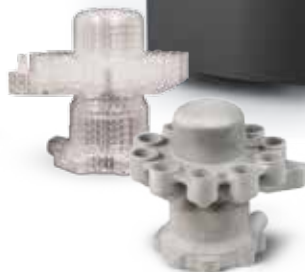
QuickCast® Gussmodell in Visijet Clear und Aluminiumabguss