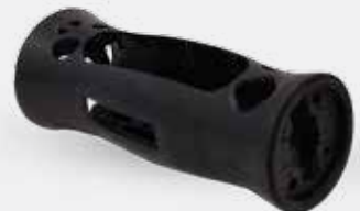
Spielzeugprototyp, gedruckt in Accura ABS Black

Mit SLA Druckern lassen sich sehr detailreiche, kleine Teile von wenigen Millimetern Größe ebenso wie bis zu 1,50 m lange Teile drucken — und zwar alle mit derselben außergewöhnlichen Auflösung und Genauigkeit. Selbst große Teile werden durchgängig präzise gedruckt, ohne Schrumpfung oder Verwindung.