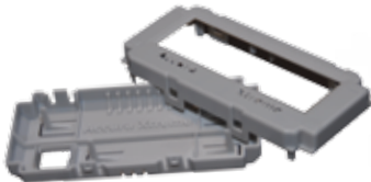
Prototyp eines Elektronikgehäuses, gedruckt in Accura Xtreme

ProX 800 und 950 sind enorm effizient. Die Kosten der Teilefertigung sind bis zu 25-mal geringer als mit anderen 3D-Präzisionsdrucktechnologien.